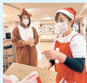
よるこんでもらえるかな

緩和ケアの提供体制としては外来、病棟、訪問診療の機能を有し、「家、ときどき病院。」「病院、ときどき家。」「住み慣れた自宅で。」をコンセプトに、地域の医療機関や訪問看護ステーションと連携し、患者さん一人ひとりが希望される暮らしをさまざまな方法でサポートできるように努めています。