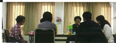
若者のための「デス＊Cafe」