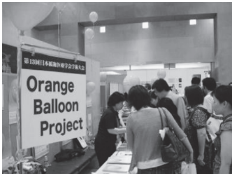
図8 第13回日本緩和医療学会学術集会