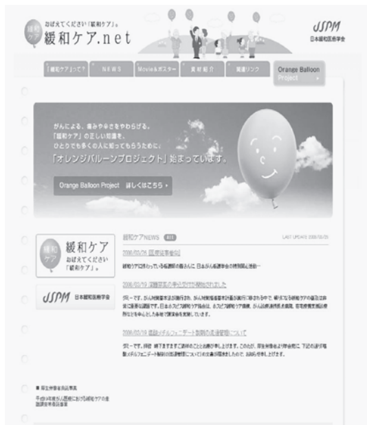
図 5 Web サイト「緩和ケア.net」