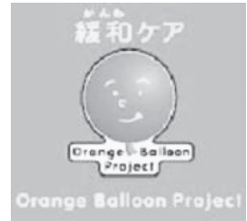
図 3 ピンバッジ