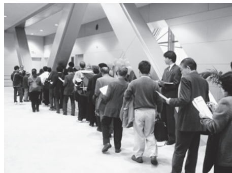
図10 日本対がん協会 50周年記念シンポジウム

スピス・在宅ケア研究会の4つの団体が協力することになり、OBPのメンバーになっていただいた。それぞれの団体は歴史をもち独自の活動を展開しており、学会のコンセプトも異なっているが、がん患者の苦痛を軽減し、QOLを改善することにおいて、活動の趣旨を共有している。2008年度からは、いよいよ普及活動を本格的に開始した。2007年度、2008年度のおもな事業の経緯を下記(表4)に示す。