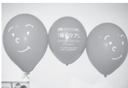
図 4 風船