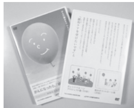
図 2 DVD 「Orange Balloon Project」と 「痛みのコントロール」