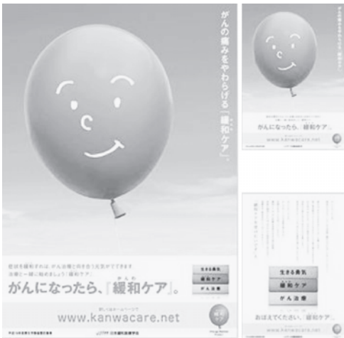
図 1 ポスターとちらし

目的：この委託費は、「がん対策推進基本計画」において、「すべてのがん診療に携わる医師が研修等により、緩和ケアについての基本的な知識を習得する」ことが目標として掲げられていることを踏まえ、がん診療に携わる医師に対する緩和ケア研修会を実施し、緩和ケアについての基本的な知識を習得させるとともに、研修指導者を育成し、併せて緩和ケアに関する普及啓発を図ることにより、治療の初期段階から緩和ケアが提供されるようにすることを目的とする。（この事業は医師の緩和ケア研修と緩和ケアの普及啓発の 2 つに分かれており、OBP は緩和ケアの普及啓発に関する委託を担当する。2007 年度に開発したパンフレット、DVD を活用して普及活動をする事、Web ページをさらに充実して普及に活用すること、シンポジウム等を開催して一般市民を啓発すること、一般市民を対象に緩和ケアの認知度について意識調査を行うことが含まれている）