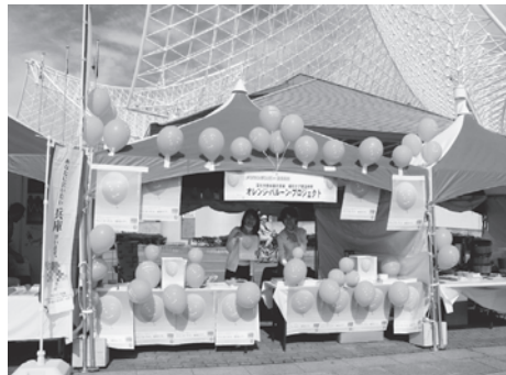
図9 第3回ラジオ関西まつり—メリケンボンバー 2008